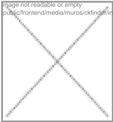
image not readable or empty public/frontend/media/muros/ckfinder/images/costumefemminile.jpg

L'abbigliamento femminile, contemporaneo a quello maschile, è così composto: copricapo, su muncaloru ippaltu, di seta, quadrangolare,